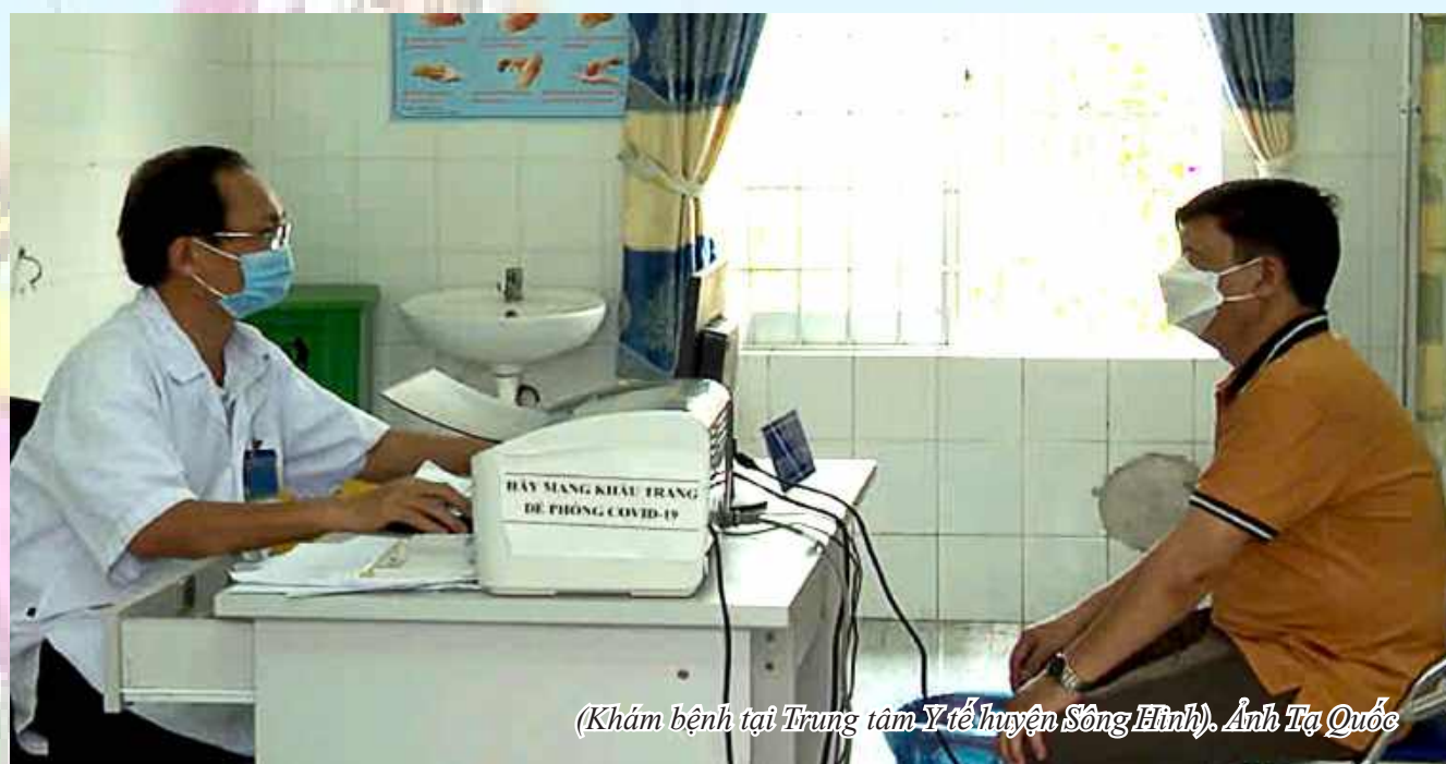
(Khám bệnh tại Trung tâm Y tế huyện Sông Hinh).

động với mô hình Bệnh viện Đa khoa làm nhiệm vụ khám chữa bệnh, Đội vệ sinh phòng dịch làm công tác dự phòng, Phòng Y tế quản lý các hoạt động của đội Y tế dự phòng và các Trạm Y tế xã. Đến giữa năm 1989 thực hiện theo mô hình Trung tâm Y tế huyện trên cơ sở sáp nhập Phòng Y tế, Bệnh viện Đa khoa và Đội Y tế dự phòng huyện thành Trung tâm Y tế huyện. Sau khi sáp nhập hoạt động Chăm sóc và Bảo vệ sức khỏe cho nhân dân trên địa bàn huyện thuận lợi hơn rất nhiều nhờ chủ động được nguồn nhân lực, trang thiết bị và hoạt động điều phối nhịp nhàng hơn. Các hoạt động khám