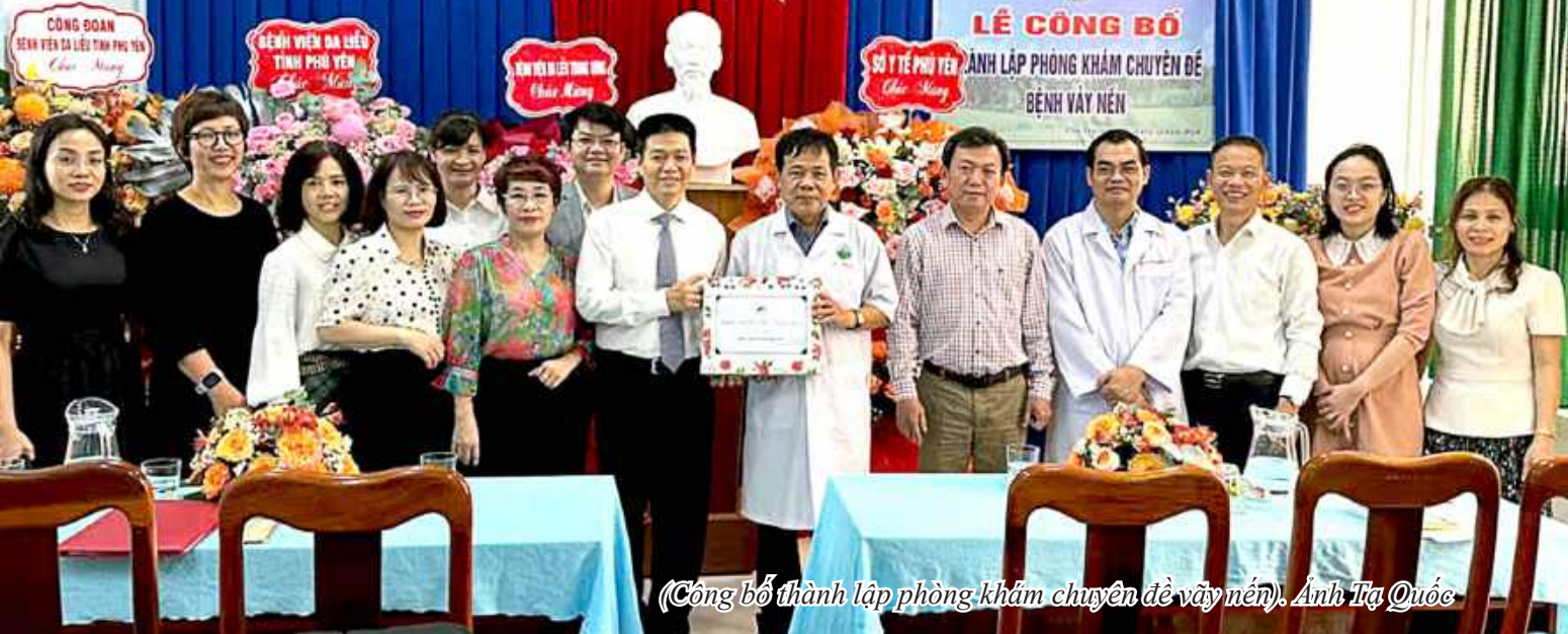
(Công bố thành lập phòng khám chuyên đề vẩy nến).

LỄ CÔNG BỐ KHAI LẬP PHÒNG KHÁM CHUYÊN ĐỀ BỆNH VẢY NÉN