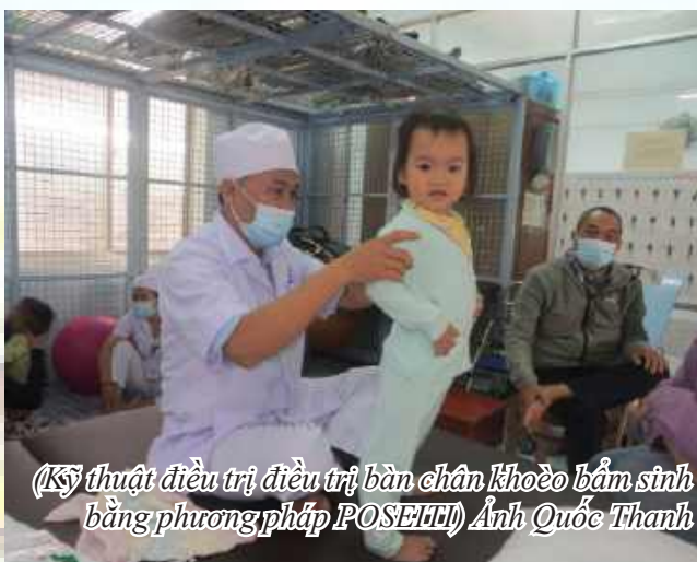
(Kỹ thuật điều trị điều trị bàn chân khoèo bẩm sinh bằng phương pháp POSETTI)

Với thế mạnh trong công tác phát triển chuyên môn kỹ thuật, thời gian tới, Bệnh viện tiếp tục thực hiện chính sách thu hút bác sỹ giỏi về làm việc, đẩy mạnh chuyển đổi số, ứng dụng công nghệ thông tin trong mọi hoạt động chuyên môn; Nâng cao ý thức, không ngừng đổi mới tinh thần, thái độ phục vụ, hướng tới sự hài lòng của người bệnh, là địa chỉ tin cậy hàng đầu trong việc khám chữa bệnh, PHCN, chăm sóc sức khỏe nhân dân. □