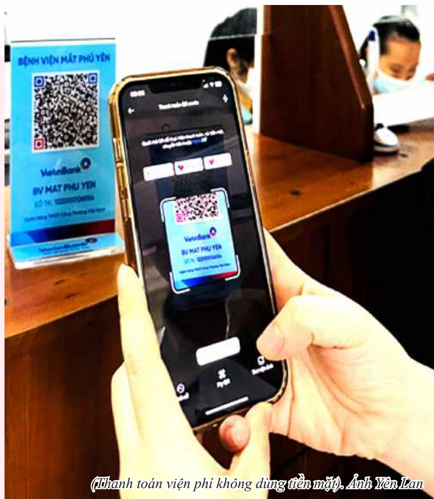
(Thanh toán viện phí không dùng tiền mặt).

6. Chính phủ số: 100% cán bộ công chức - viên chức sử dụng hệ thống QLVB&ĐH trong công việc. Tiếp tục vận hành, khai thác phần mềm quản lý văn bản iOffice phiên bản 5.0 để nâng cao hiệu quả tiếp nhận, xử lý, ban hành văn bản của đơn vị, đáp ứng yêu cầu về xây dựng hồ sơ điện tử theo Nghị định số 30/2020/NĐ-CP ngày 05/3/2020 của Chính phủ về công tác văn thư. Cập nhật đầy đủ 100% hồ sơ công chức, viên chức,