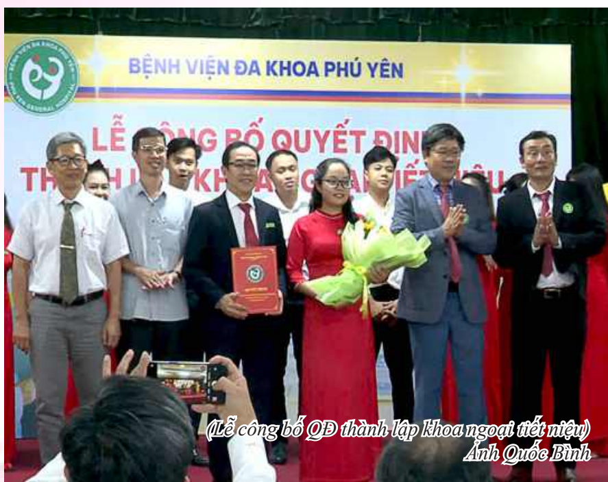
(Lễ công bố QĐ thành lập khoa ngoại tiết niệu)

35 năm qua, vượt qua biết bao khó khăn thử thách, Bệnh viện Đa khoa Phú Yên đã có những đóng góp to lớn trong công tác khám chữa bệnh, chăm sóc và bảo vệ sức khỏe nhân dân; các thế hệ thầy thuốc Bệnh viện Đa khoa Phú Yên luôn yêu nghề, không ngừng nỗ lực, đặt chất lượng - an toàn - hài lòng người bệnh là trọng tâm.