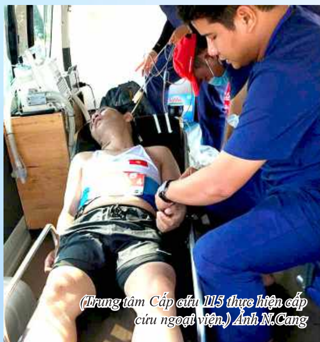
(Trung tâm Cấp cứu 115 thực hiện cấp cứu ngoại viện.)

Trung tâm chú trọng đẩy mạnh công tác điều hành, điều phối, quy chế phối hợp thống nhất hệ thống cấp cứu ngoại viện, trước bệnh viện của tỉnh, bao gồm: Trung tâm Cấp cứu 115, mạng lưới các tổ cấp cứu ngoại viện trực thuộc trung tâm y tế 9 huyện, thị xã, thành phố, các cơ sở khám chữa bệnh có hoạt động xe cấp cứu. Đồng thời, xây dựng các quy trình hoạt động, điều hành, vận chuyển cấp cứu giữa Trung tâm Cấp cứu 115 với các cơ sở khám chữa bệnh trên địa bàn tỉnh kịp thời ứng phó với các tình huống xảy ra thảm họa, thiên tai, phù hợp với điều kiện thực tiễn trên địa bàn tỉnh Phú Yên. Triển khai ứng dụng CNTT, công nghệ thông minh trong việc định vị chính xác địa chỉ của người điện thoại yêu cầu cần sự trợ giúp cấp cứu, đảm bảo người bệnh được cấp cứu nhanh nhất, an toàn và hiệu quả. □