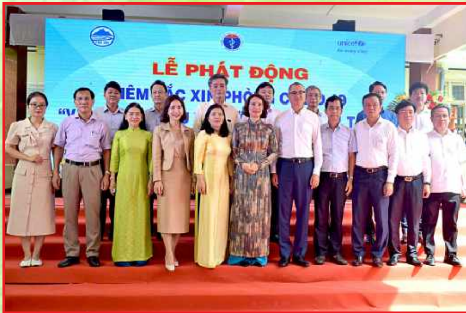
Thứ trưởng BYT và lãnh đạo tỉnh Phú Yên tại Lễ phát động tiêm vắc xin phòng Covid-19