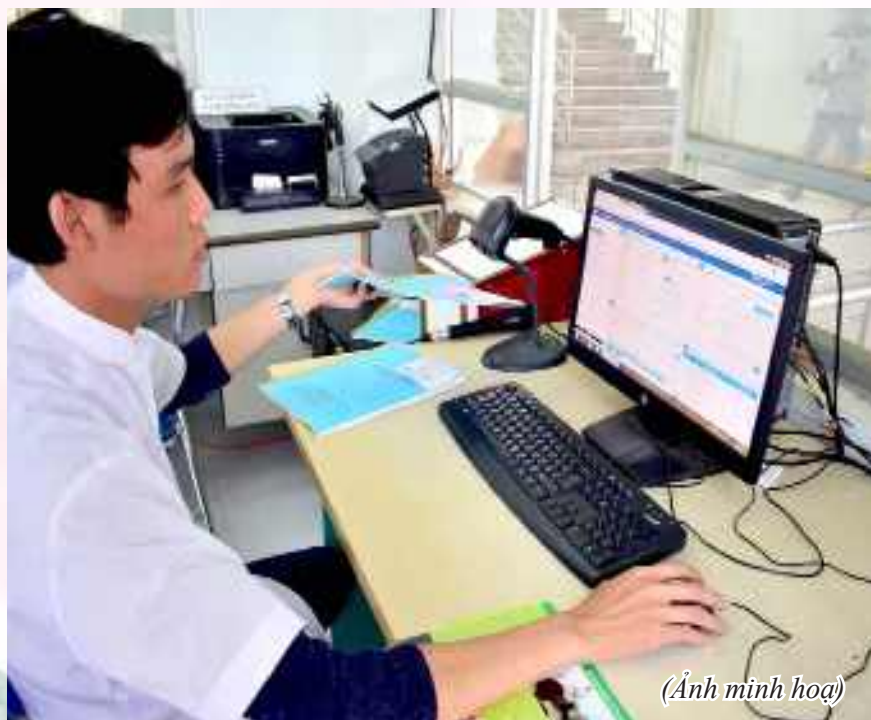
(Ảnh minh họa)

người lao động cơ quan lên phần mềm CSDL.