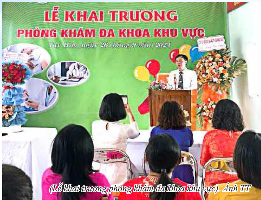
(Lễ khai trương phòng khám đa khoa khu vực).

Nhằm nâng cao chất lượng dịch vụ y tế và cải thiện công tác chăm sóc sức khỏe cho cộng đồng, ngày 14/8/2024, Sở Y tế Phú Yên đã ban hành Quyết định thành lập Phòng khám đa khoa khu vực thuộc Trung tâm Y tế thành phố Tuy Hòa.