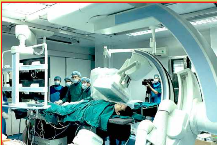
Bệnh viện Đa khoa tỉnh Phú Yên áp dụng công nghệ cao trong điều trị bệnh