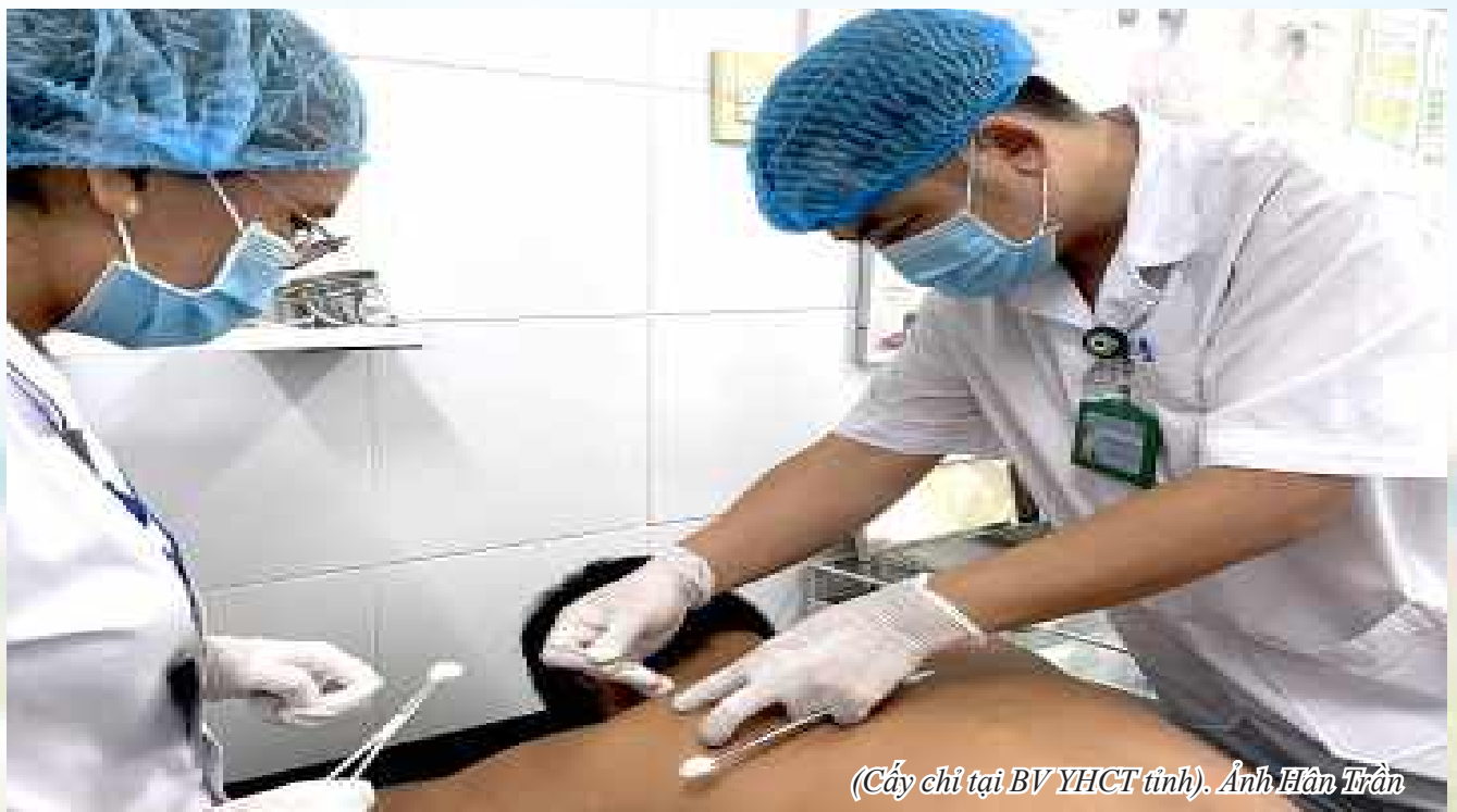
(Cấy chỉ tại BV YHCT tỉnh).

Bệnh viện Y học cổ truyền Phú Yên không chỉ là nơi hội tụ tinh hoa y học cổ truyền, mà còn là niềm tự hào của ngành y tế địa phương, góp phần quan trọng trong việc bảo vệ và nâng cao sức khỏe cộng đồng. □