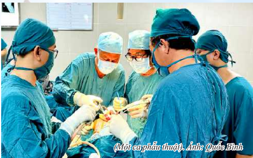
(Một ca phẫu thuật).

Các cơ sở khám chữa bệnh thực hiện đồng bộ nhiều giải pháp nâng cao chất lượng dịch vụ y tế, đổi mới phong cách làm việc và nâng cao chất lượng chuyên môn. Nhiều bệnh viện đã có chuyển biến tích cực trong cải tiến quy trình khám bệnh, cải tiến các điều kiện phục vụ người bệnh, đáp ứng sự hài lòng người bệnh, chủ động tiếp nhận và triển khai áp dụng nhiều dịch vụ kỹ thuật mới trong chẩn đoán và điều trị bệnh từ các bệnh viện tuyến trên. Bệnh viện Đa khoa Phú Yên tiếp tục hợp tác với Bệnh viện Chợ Rẫy trong việc tiếp nhận và triển khai phẫu thuật ngoại thần kinh - cột sống, với Bệnh viện Răng Hàm Mặt TP Hồ Chí Minh (phẫu thuật phức tạp vùng hàm mặt), với Bệnh viện Đại học Y Hà Nội (phẫu thuật tiết niệu chuyên sâu), với Bệnh viện Bệnh nhiệt đới Trung ương (điều trị các bệnh truyền nhiễm). Bệnh viện Sản - Nhi Phú Yên hợp tác với Bệnh viện Từ Dũ trong phẫu thuật nội soi phụ khoa, cấp cứu sản phụ