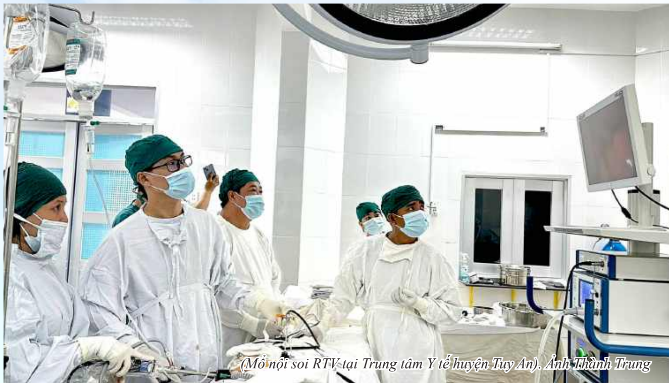
(M Ỗn Ỗi soi RTV tại Trung tâm Y tế huyện Tuy An).

B SCKI. NGUYỄN TH ỖNH TRUNG PGĐ phụ trách, TTYT huyện Tuy An