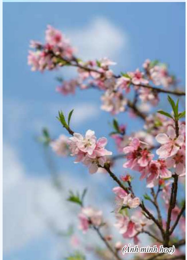
(Ảnh minh họa)

Cánh cò, tiếng mẹ ầu ơ Canh gà tiếng gáy cơm no ra đồng Trẻ thơ trang sách màu hồng Sắc Xuân thương quá... em còn về không?