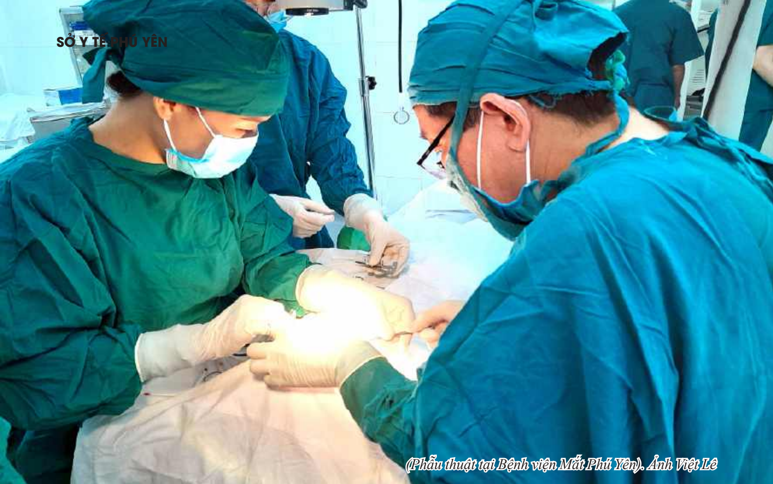
(Phẫu thuật tại Bệnh viện Mắt Phú Yên).