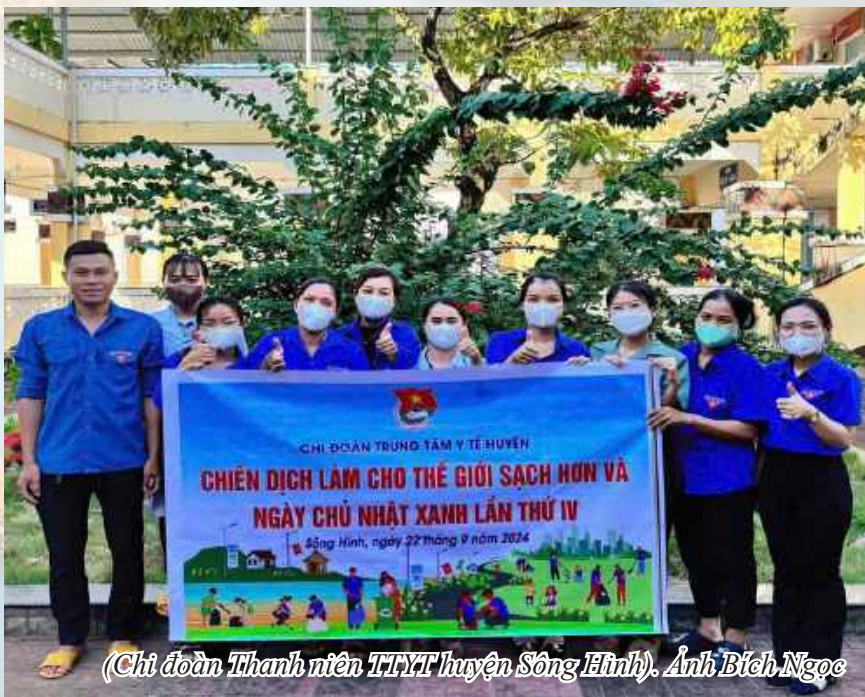
(Chi đoàn Thanh niên TTYT huyện Sông Hinh).

Đoàn viên thanh niên còn tích cực tham gia ngày hội hiến máu tình nguyện năm 2024 với tổng cộng 06 đơn vị máu. Thực hiện chương trình chào đón Trung thu cho các bé bệnh nhi đang điều trị tại TTYT huyện Sông Hinh với gần 40 suất quà được gửi đến các bé; Chương trình “Tình nguyện mùa đông” hỗ trợ người dân xã Ea Bá, đã kêu gọi quyên góp được 50 chiếc chăn lông, hàng chục bộ quần áo dành tặng cho người bệnh trong mùa đông giá lạnh. Kêu gọi và duy trì thường niên quầy hàng miễn phí cho người bệnh và người nhà người bệnh.