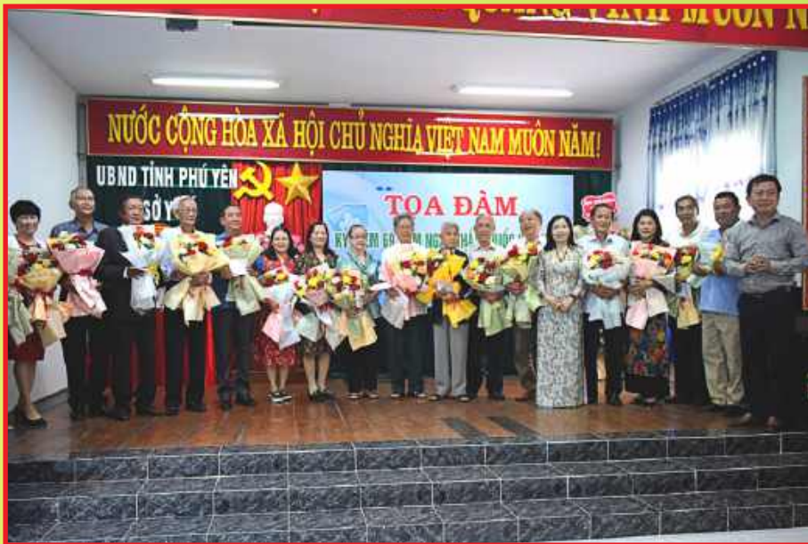
Toạ đàm kỷ niệm ngày thầy thuốc Việt Nam 27/02