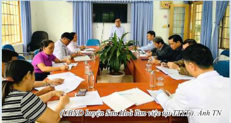
(UBND huyện Sơn Hoà làm việc tại TTYT).

Ngày 26/12/2024, Lãnh đạo UBND huyện Sơn Hòa và các Phòng ban chuyên môn tổ chức gặp mặt, làm việc với TTYT, để kịp thời chỉ đạo, động viên tinh thần cán bộ, viên chức và người lao động, ổn định tư tưởng, tiếp tục thực hiện nhiệm vụ chính trị của ngành y tế và ban hành quyết định tiếp nhận viên chức TTYT huyện; đồng thời chỉ đạo các cơ quan chuyên môn của huyện khẩn trương, phối hợp Trung tâm rà soát, giải quyết kịp thời, đúng tiến độ và tạo điều kiện thuận lợi để TTYT huyện hòa nhập vào hoạt động chung của huyện, không làm phát sinh thêm nhiệm vụ ảnh hưởng đến việc thực hiện nhiệm vụ chuyên môn (của TTYT cũng như nhiệm vụ chuyên môn của các Trạm Y tế xã); kịp thời báo cáo những khó khăn, vướng mắc để cấp có thẩm