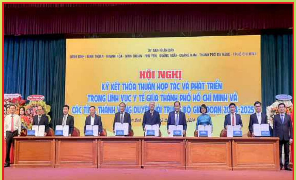
Hội nghị Ký kết thỏa thuận hợp tác và phát triển trong lĩnh vực y tế giữa Tp Hồ Chí Minh và các tỉnh thành vùng Duyên Hải Trung Bộ giai đoạn 2024-2025