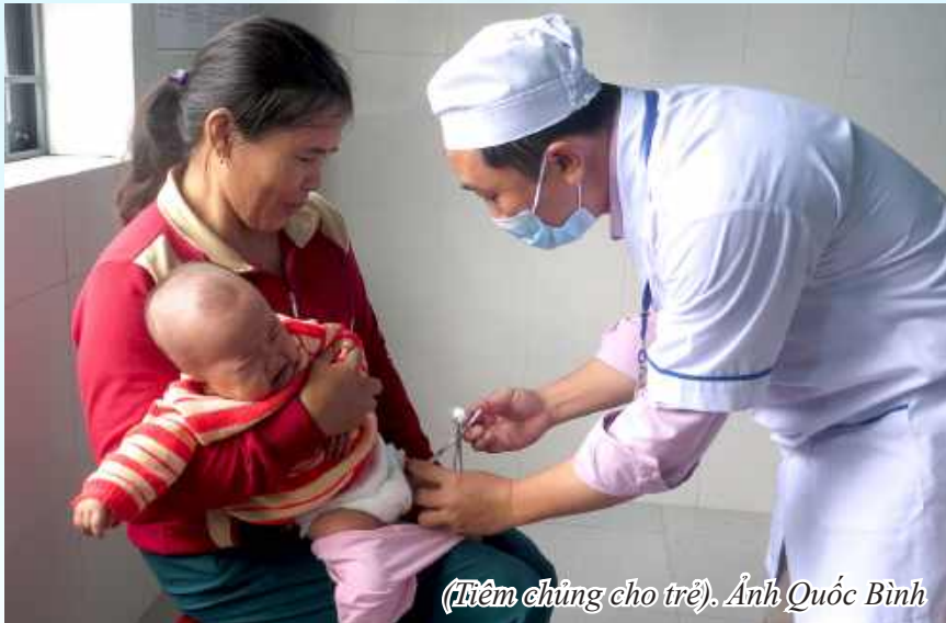
(Tiêm chủng cho trẻ).